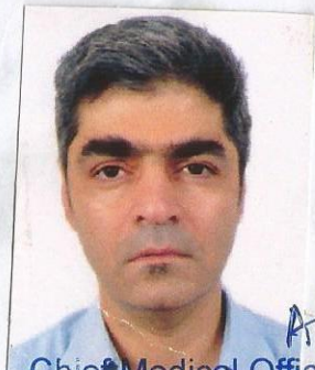
Chief Medical Officer Gautam Buddha Nagar

अन्यथा की दशा में आपका रजिस्ट्रेशन निरस्त करने की कार्यवाही अमल में लाई जा सकती है। उपरोक्त पंजीकरण 31 मार्च 2018 तक मान्य होगा।